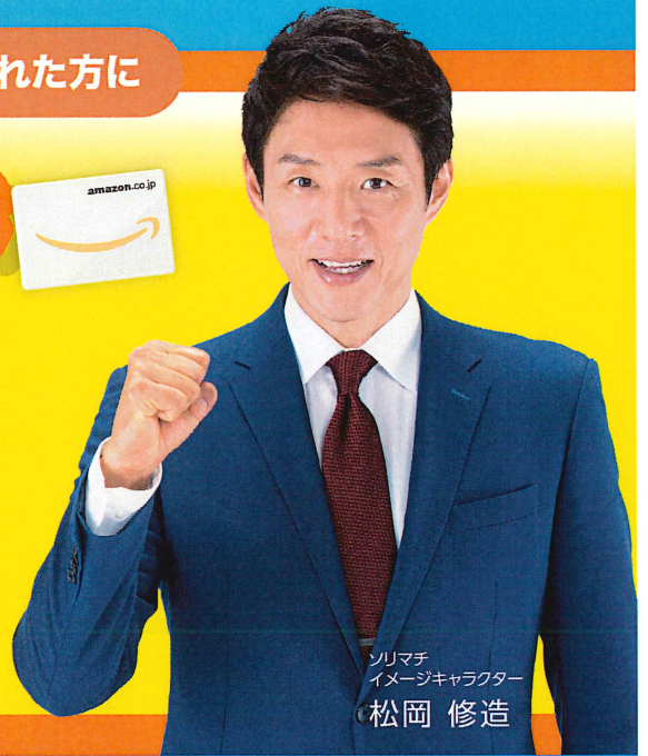
ソリマチ イメージキャラクター 松岡 修造